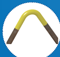
Crochet jaune 0 - 4 tonnes