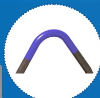
Crochet bleu 4 - 7 tonnes