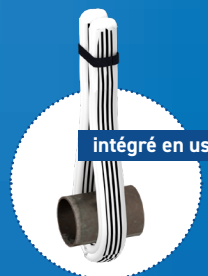
intégré en usine