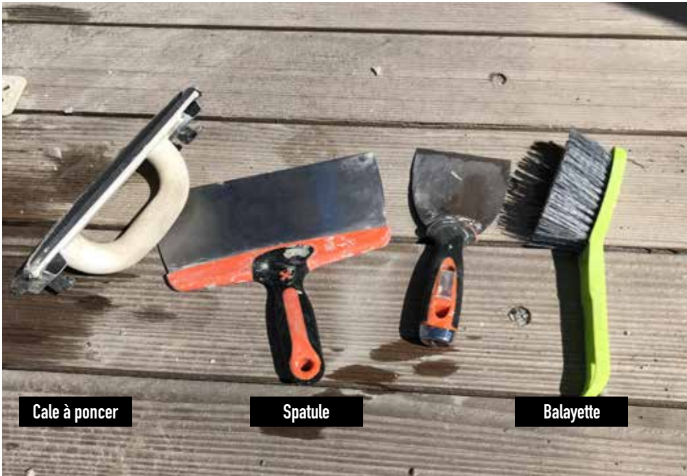
Cale à poncer