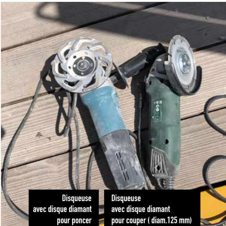
Disqueuse avec disque diamant pour poncer