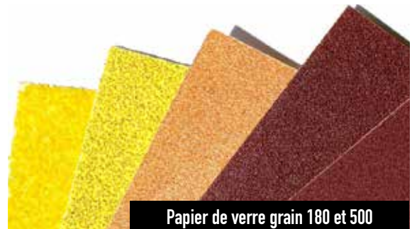
Papier de verre grain 180 et 500