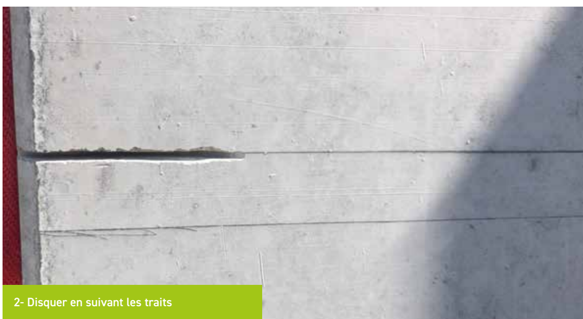
2- Disquer en suivant les traits