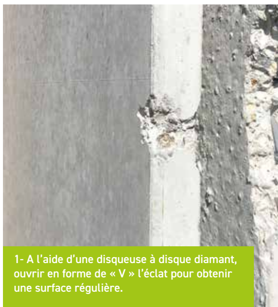
1- A l'aide d'une disqueuse à disque diamant, ouvrir en forme de « V » l'éclat pour obtenir une surface régulière.

Avant d'entreprendre la réparation, nous vous conseillons de préparer votre enduit mélangé avec du ciment pour obtenir la teinte la plus proche de votre mur. Ici, nous utilisons du Lankomur 101 et 102 (cf annexe B).