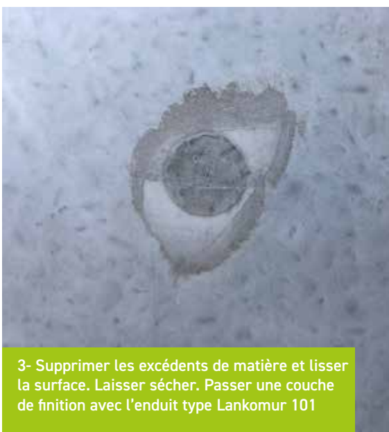
3- Supprimer les excédents de matière et lisser la surface. Laisser sécher. Passer une couche de finition avec l'enduit type Lankomur 101