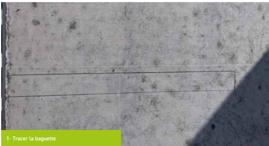
1- Tracer la baguette

Avant d'entreprendre la modification, nous vous conseillons de préparer votre enduit mélangé avec du ciment pour obtenir la teinte la plus proche de votre mur. Ici, nous utilisons du Lankomur 101 et 102 (annexe B). (ciment utilisé pour la fabrication de votre mur disponible sur simple demande à votre commercial Spurgin)