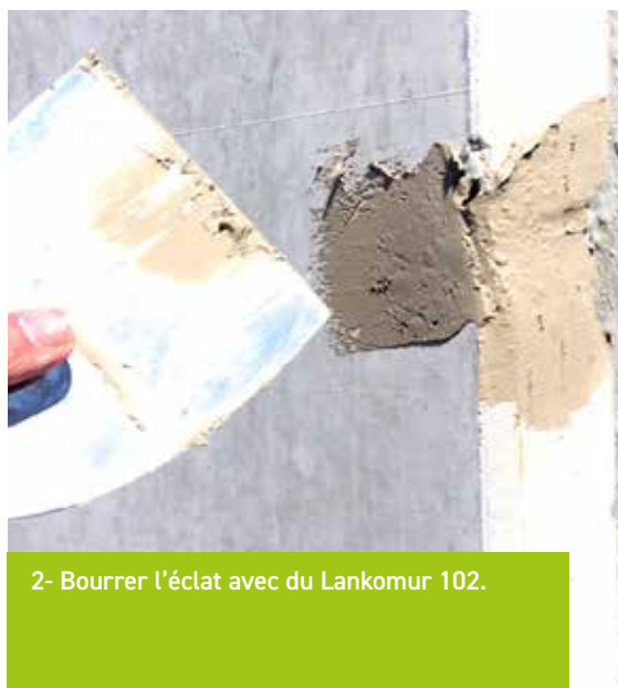
2- Bourrer l'éclat avec du Lankomur 102.