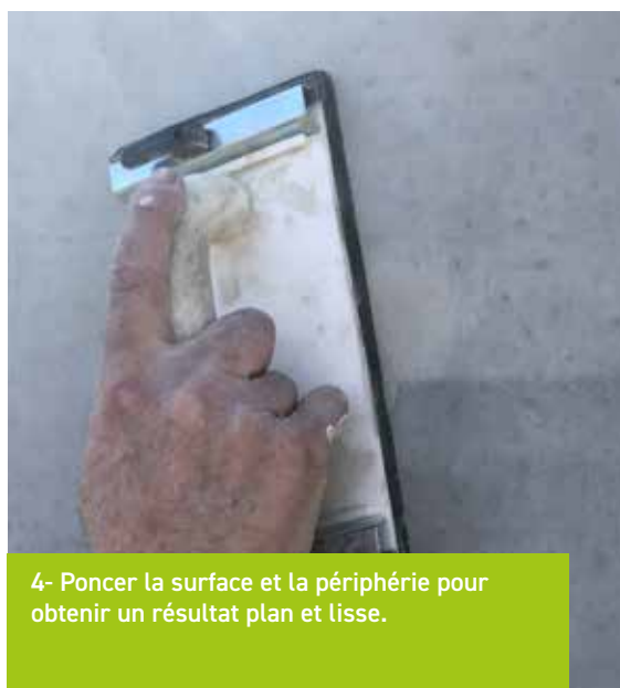
4- Poncer la surface et la périphérie pour obtenir un résultat plan et lisse.