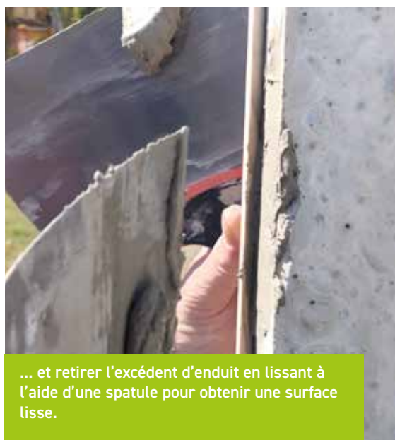
... et retirer l'excédent d'enduit en lissant à l'aide d'une spatule pour obtenir une surface lisse.