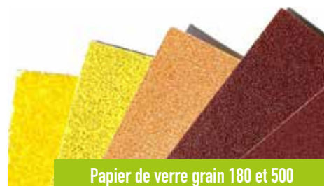
Papier de verre grain 180 et 500