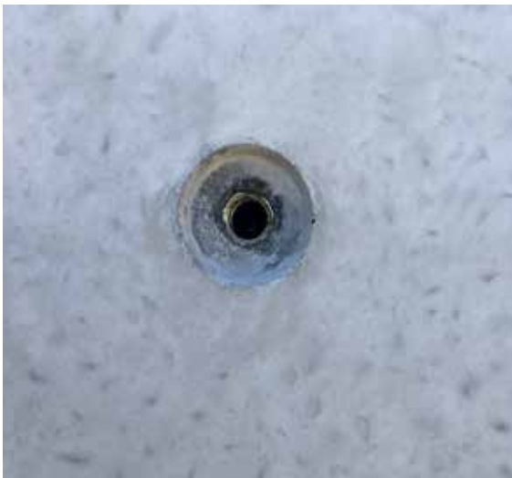
1- Nettoyer l'intérieur de la douille.