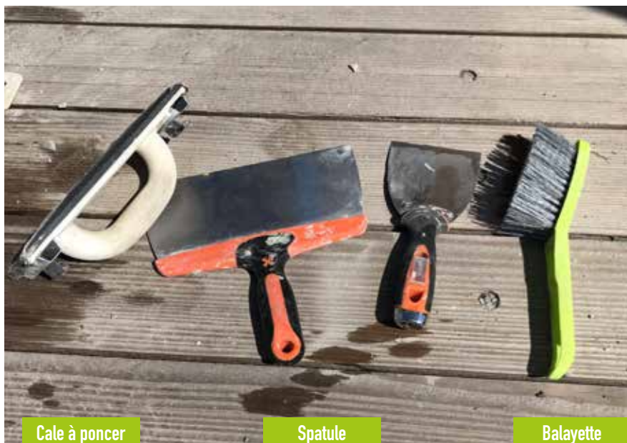
Cale à poncer