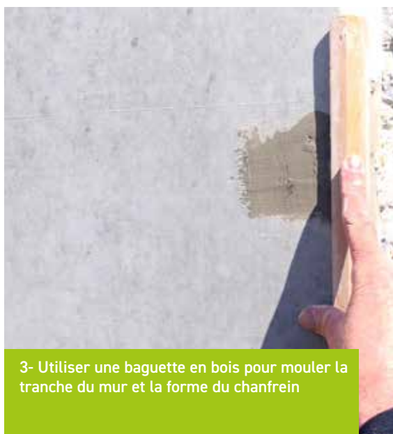
3- Utiliser une baguette en bois pour mouler la tranche du mur et la forme du chanfrein