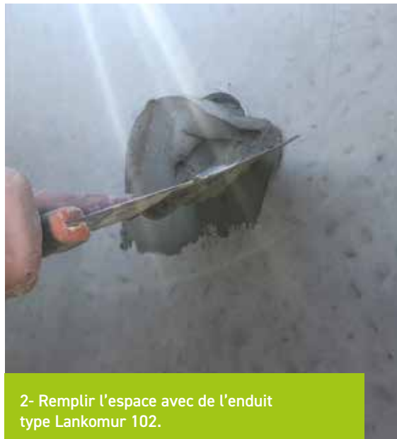
2- Remplir l'espace avec de l'enduit type Lankomur 102.