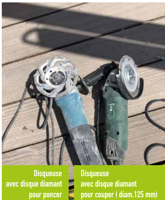
Disqueuse avec disque diamant pour poncer