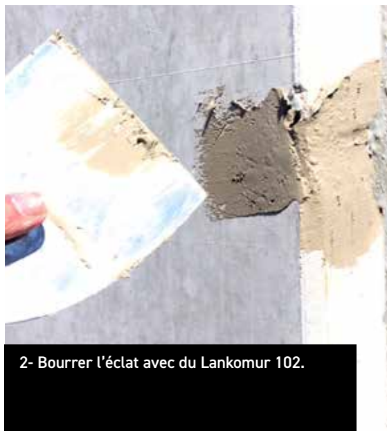
2- Bourrer l'éclat avec du Lankomur 102.