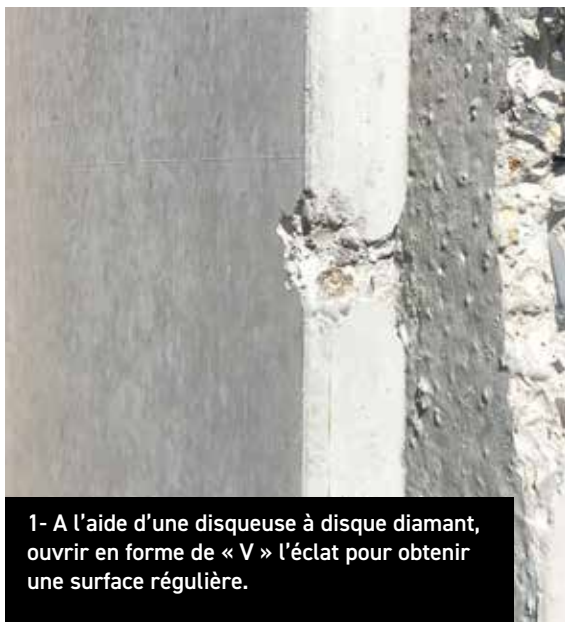
1- A l'aide d'une disqueuse à disque diamant, ouvrir en forme de « V » l'éclat pour obtenir une surface régulière.