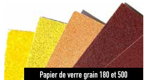
Papier de verre grain 180 et 500