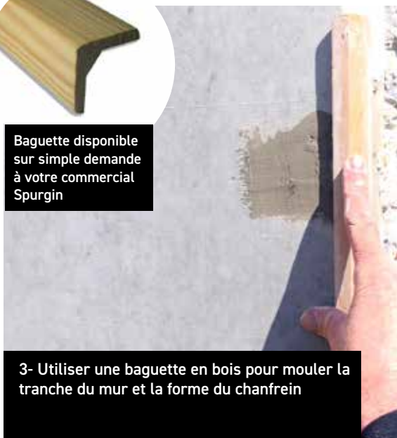
3- Utiliser une baguette en bois pour mouler la tranche du mur et la forme du chanfrein