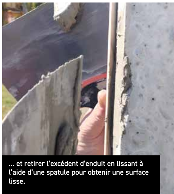
... et retirer l'excédent d'enduit en lissant à l'aide d'une spatule pour obtenir une surface lisse.