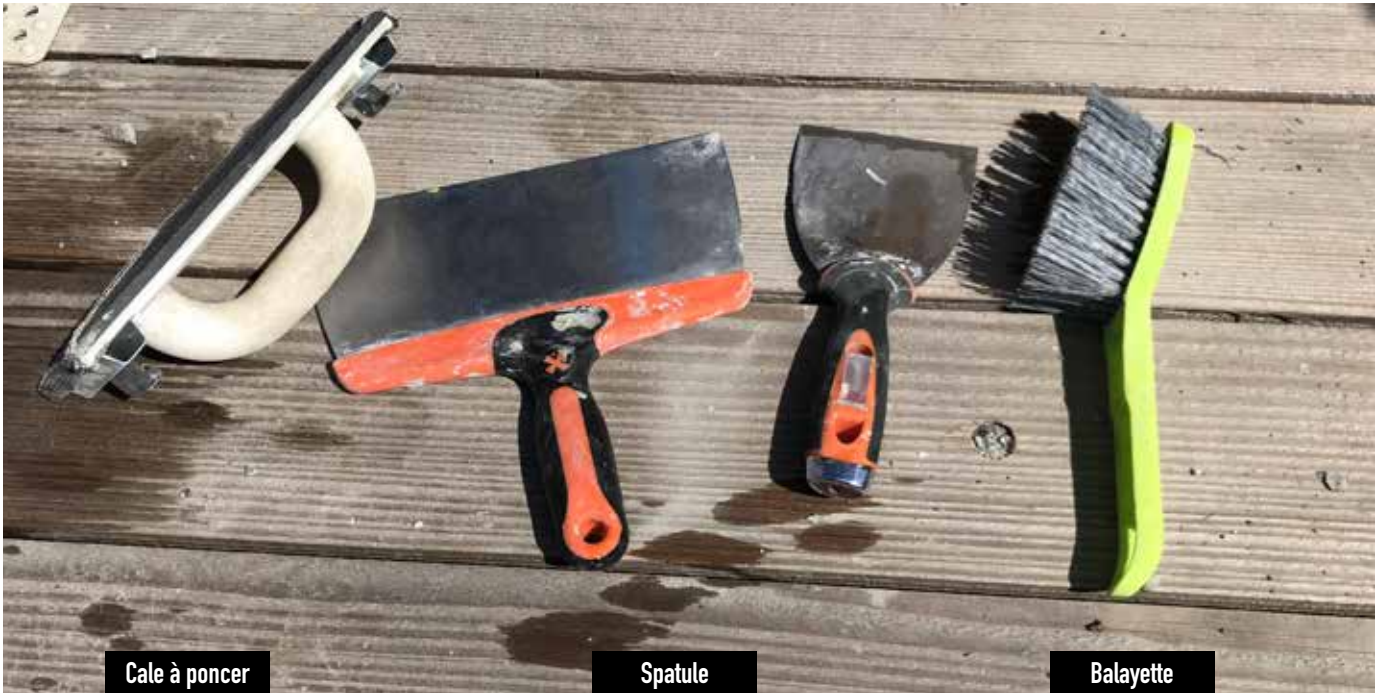
Cale à poncer