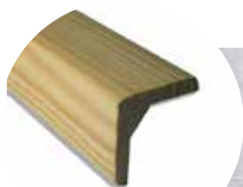
Baguette disponible sur simple demande à votre commercial Spurgin