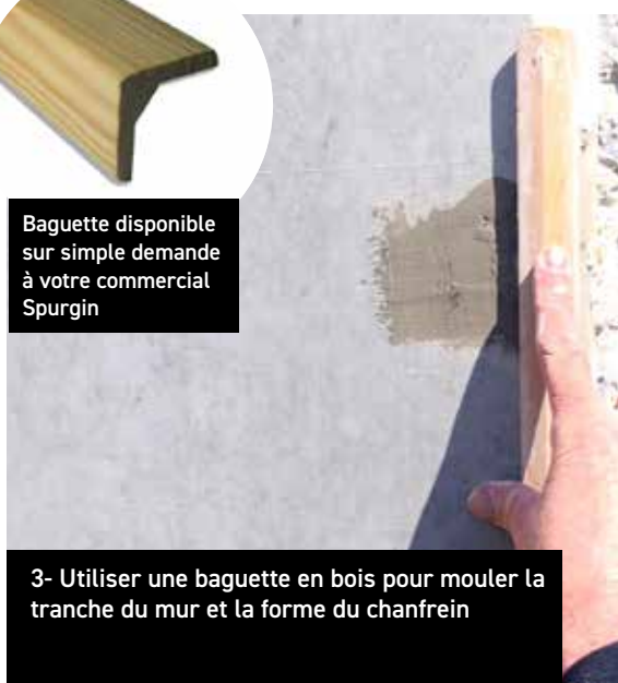
3- Utiliser une baguette en bois pour mouler la tranche du mur et la forme du chanfrein