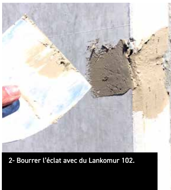
2- Bourrer l'éclat avec du Lankomur 102.