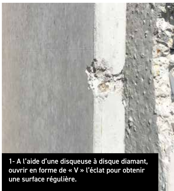
1- A l'aide d'une disqueuse à disque diamant, ouvrir en forme de « V » l'éclat pour obtenir une surface régulière.