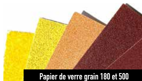
Papier de verre grain 180 et 500