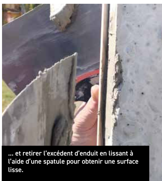
... et retirer l'excédent d'enduit en lissant à l'aide d'une spatule pour obtenir une surface lisse.