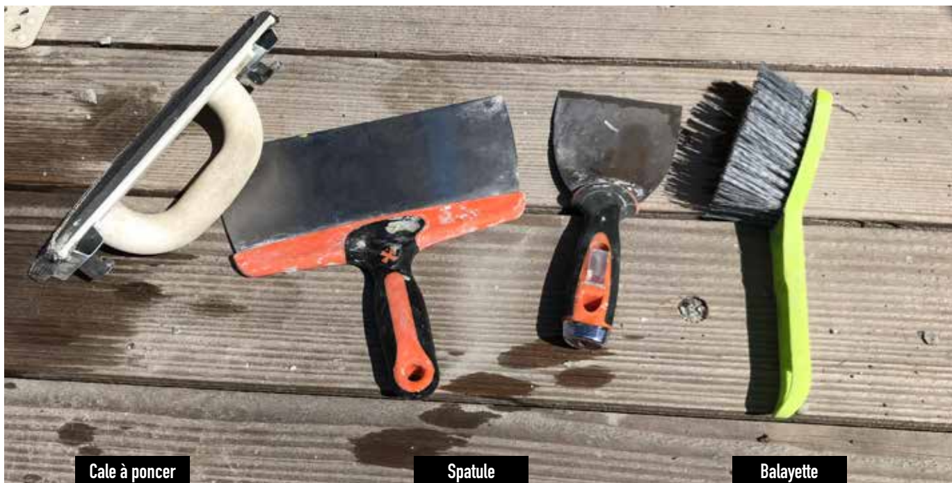
Cale à poncer